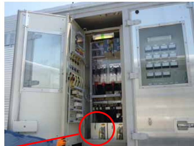
充電器盤内の基盤（制御車）