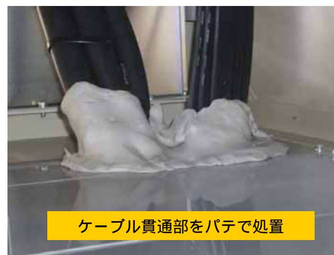
ケーブル貫通部をパテで処置