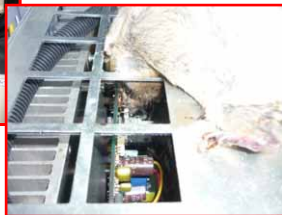
基盤への接触の状況（拡大）