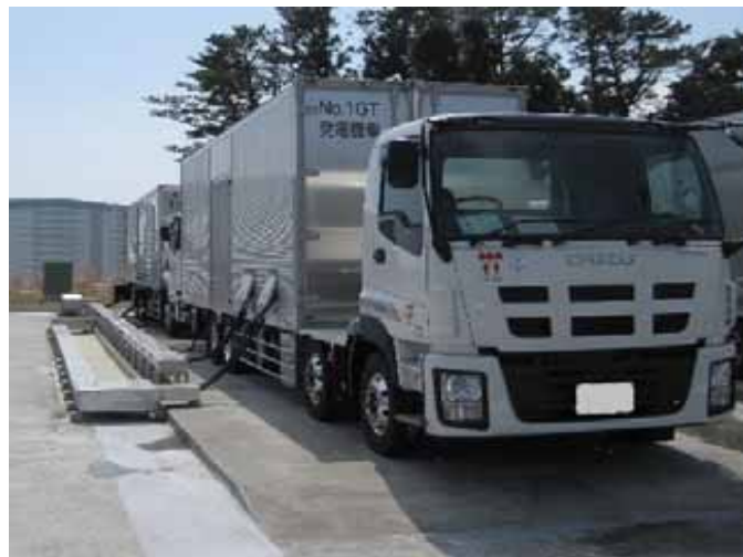
空冷式ガスタービン発電機車(No.1) (手前：発電機車 奥：制御車)