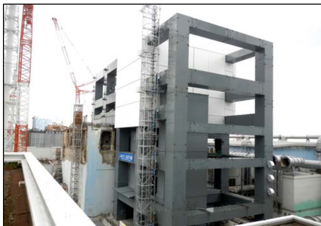
④鉄骨建方完了 (平成25年5月29日)