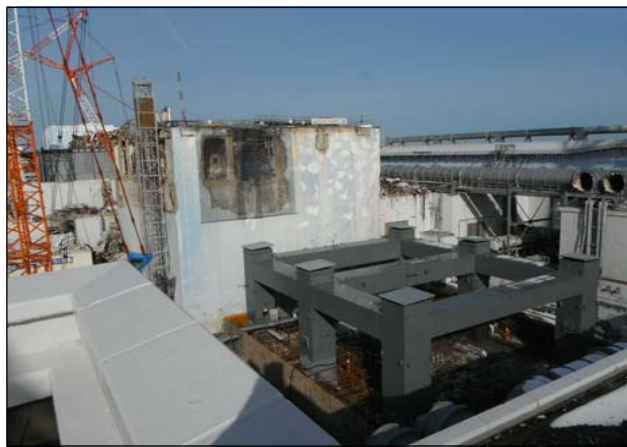
②第一節 鉄骨建方完了 (平成25年1月14日)