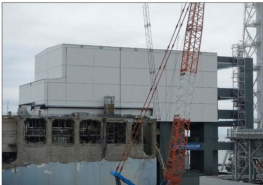
外壁・屋根パネル設置完了（7月20日）

なお、カバー内に設置する天井クレーンや燃料取扱機については、7月13日に全てカバー内へ吊り込みを完了し、現在組み立て作業中です。今後、燃料取り出しに向けて、カバーへの受電作業や天井クレーン等の作動確認を組み立て作業と並行して行っていく予定です。