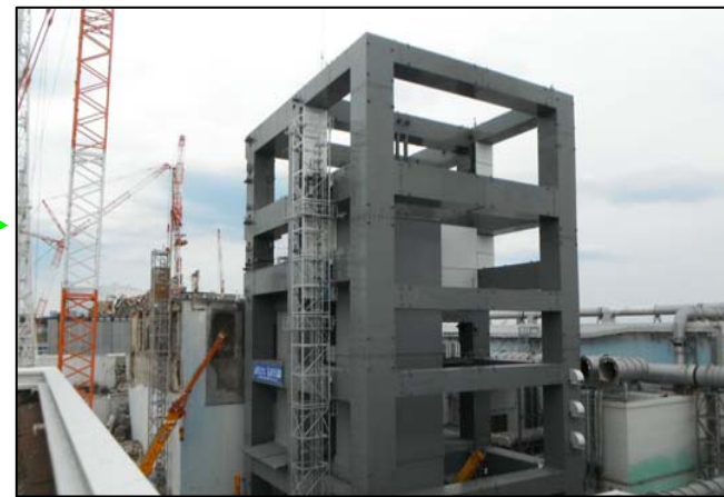
③原子炉建屋上部を除く鉄骨建方完了 (平成25年4月10日)