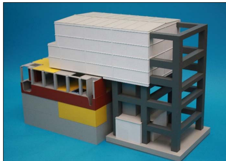
燃料取り出し用カバー完成イメージ（模型）