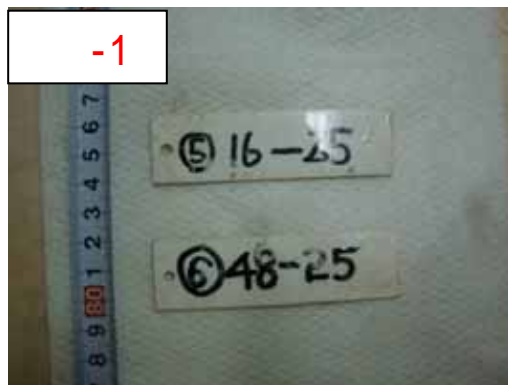
【撮影】平成25年7月10日 【提供】東京電力株式会社