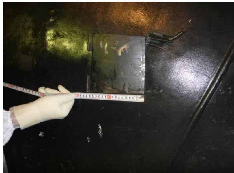
離脱せず当初の場所に残っていた 梯子用ゴムパッド (固定されていたテープを 取り外し、寸法測定を実施)