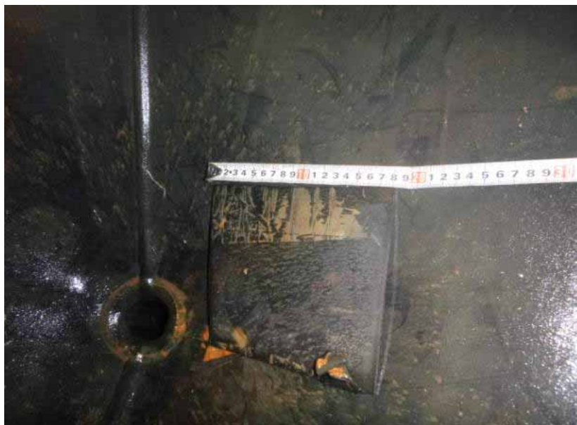
離脱した梯子用ゴムパッド (ドレン孔付近で発見)