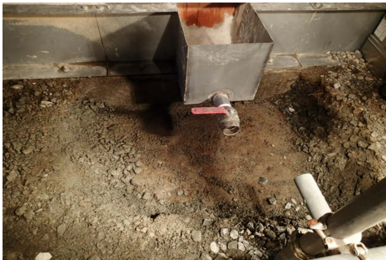
H6エリア堰内溜まり水漏えいに対する 応急的な止水処置の状況