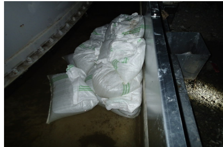
H6エリア堰内溜まり水漏えいに対する 応急的な止水処置の状況