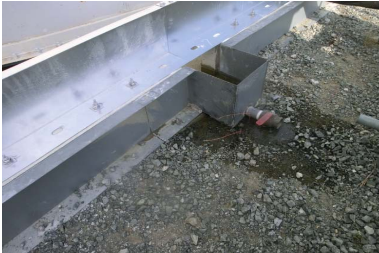
H6エリア堰内溜まり水の漏えい