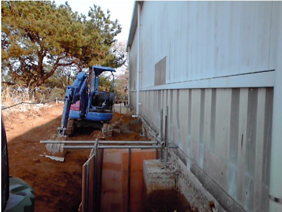
空テナ倉庫付近の現場の状況(1)