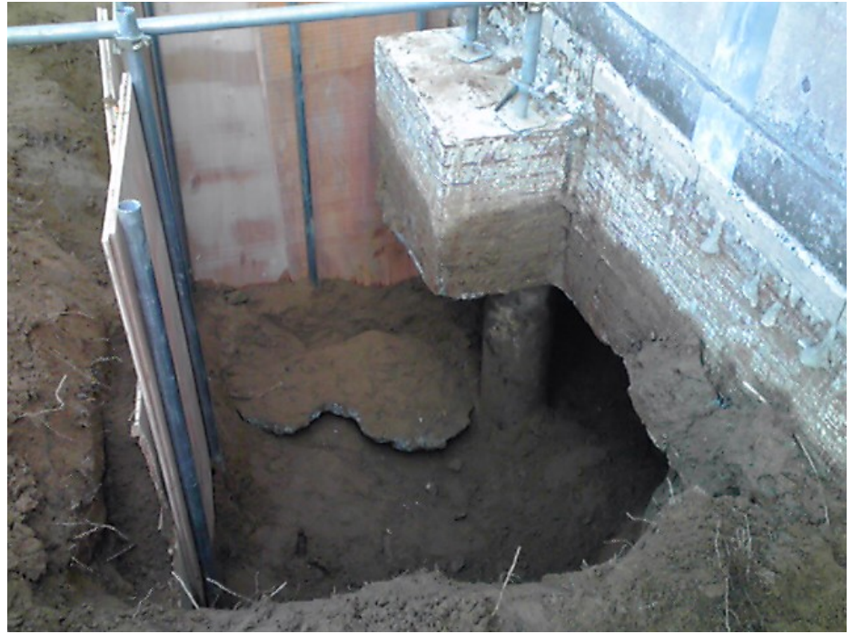
空テナ倉庫付近の現場の状況(2)