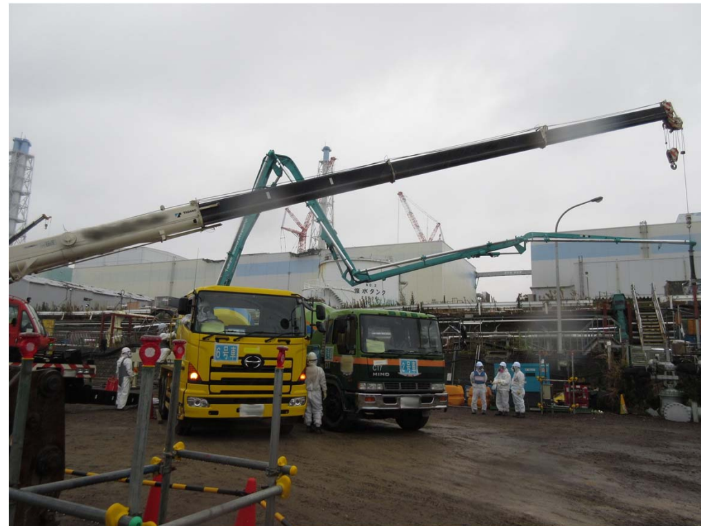
2号機海水配管トレンチ 閉塞充填作業の様子