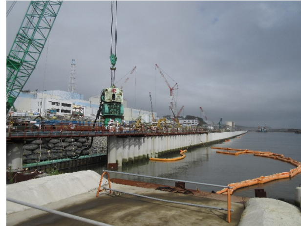
< 鋼管矢板 >