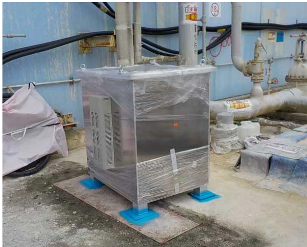
ミュオン測定装置設置 (小型装置, 約1m×1m×高さ1.3m)