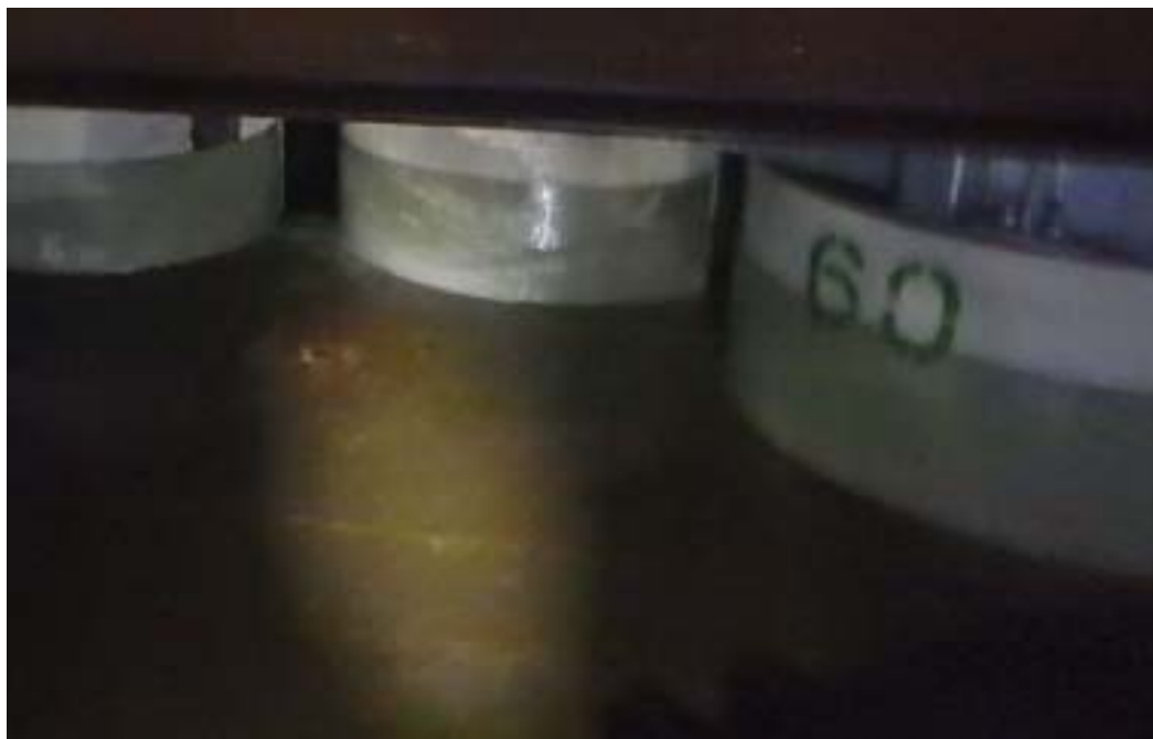
海側遮水壁北側に変状なし