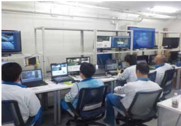
遠隔無人口ボットを操作している様子