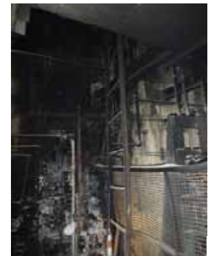
計装ラック付近 （近傍）