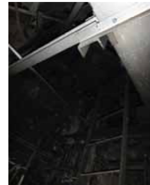
計装ラック付近 上部（近傍）