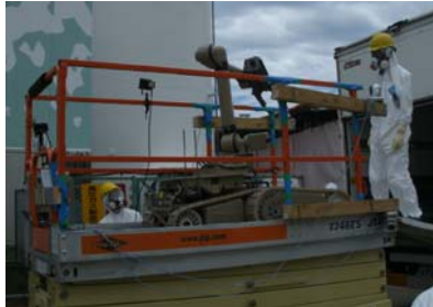
高所作業車（遮へい前） 平成23年7月7日