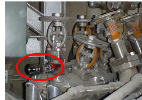
窒素封入予定箇所 （カプラ仮付け後） 平成23年7月8日