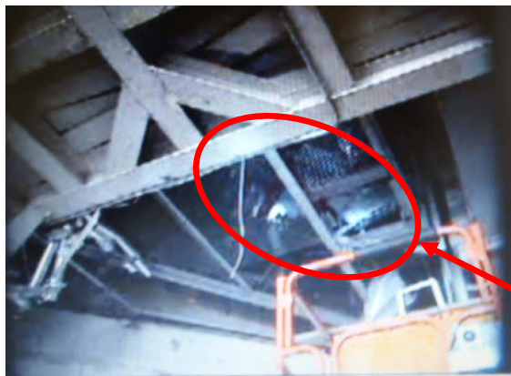
アクセス箇所 平成23年7月8日 Packbotにて撮影