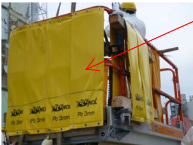
高所作業車（遮へい後） 平成23年7月8日