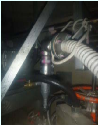
B.グレーチングへの ホース立ち上げ部