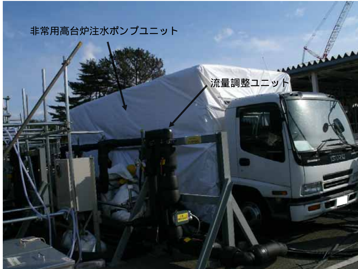
小屋がけ外観 （非常用高台炉注水ポンプユニット）