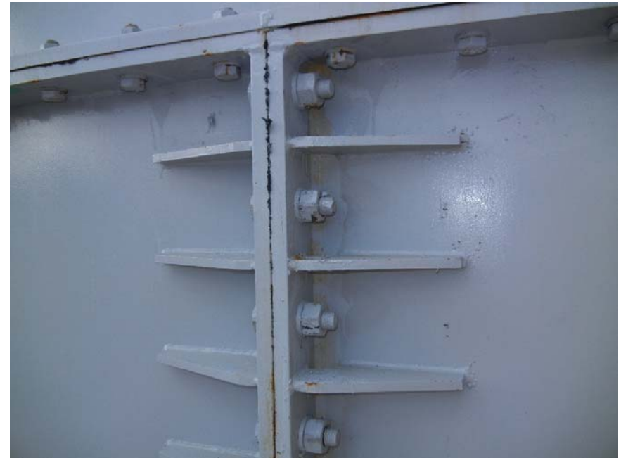
<増し締め後、漏えいが停止>