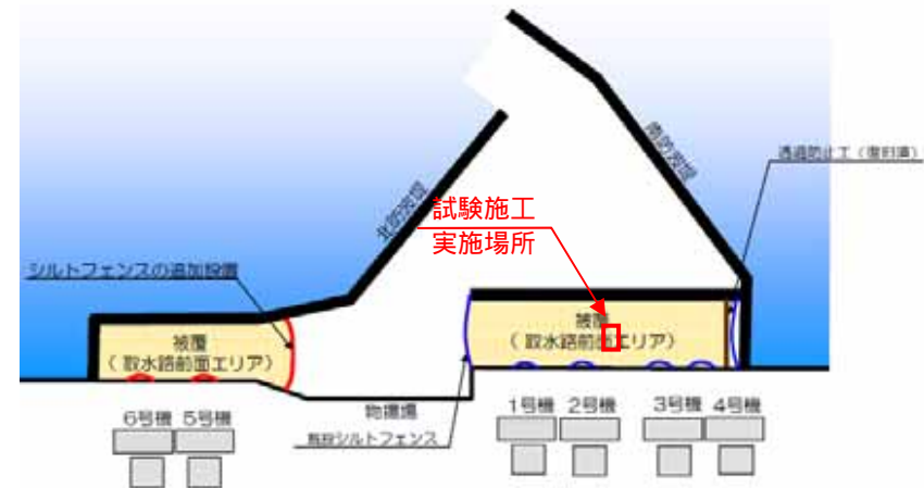
図 - 1 被覆工事実施場所