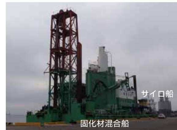
写真 - 1 作業船団（小名浜港にて撮影）