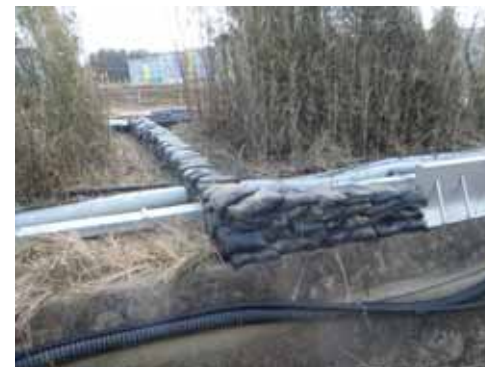
< H6エリア(東側) >