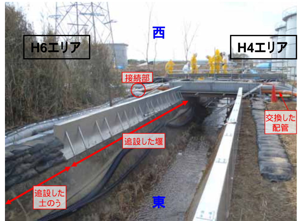
< H6エリア(左)およびH4エリア(右) >