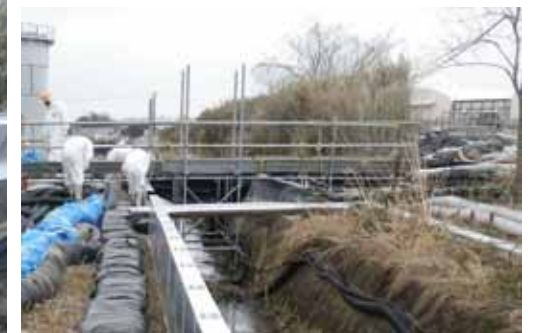
< H6エリア(西側) >

撮影日：平成24年3月27日(上左) 平成24年3月28日(右)