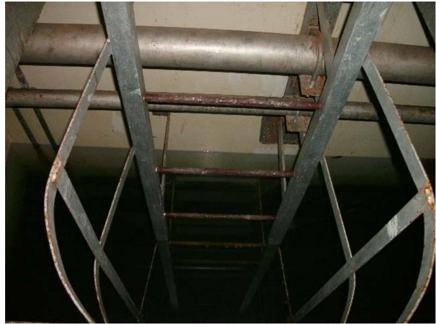
②廃樹脂貯蔵タンク室 北壁