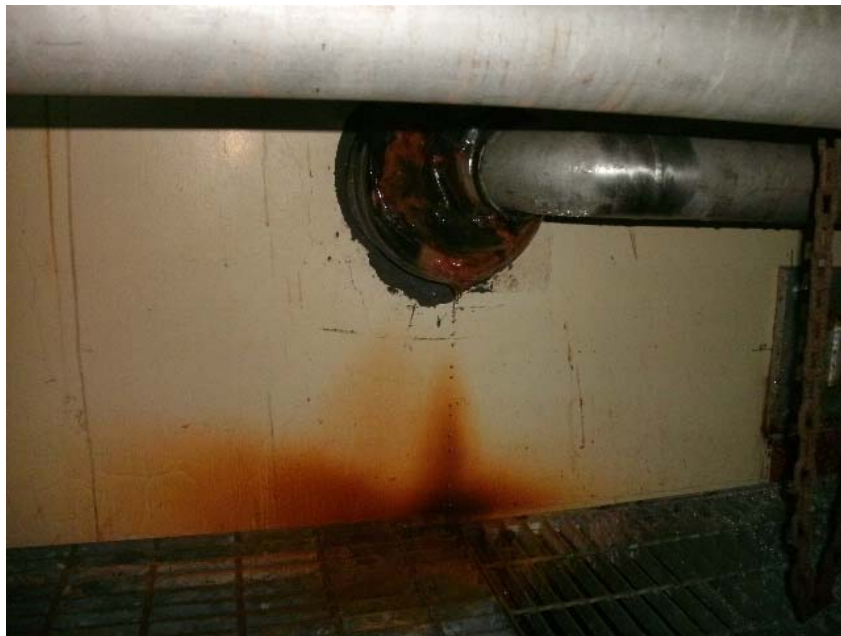
①2号機オフガス配管ダクト 流水確認部