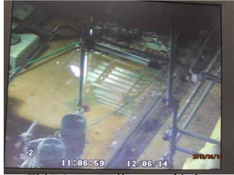
監視カメラ画像( の拡大)