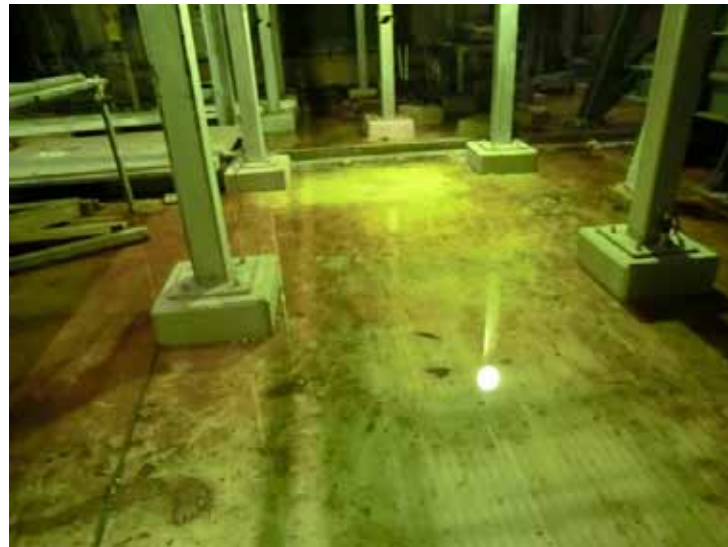
現場にて直接撮影