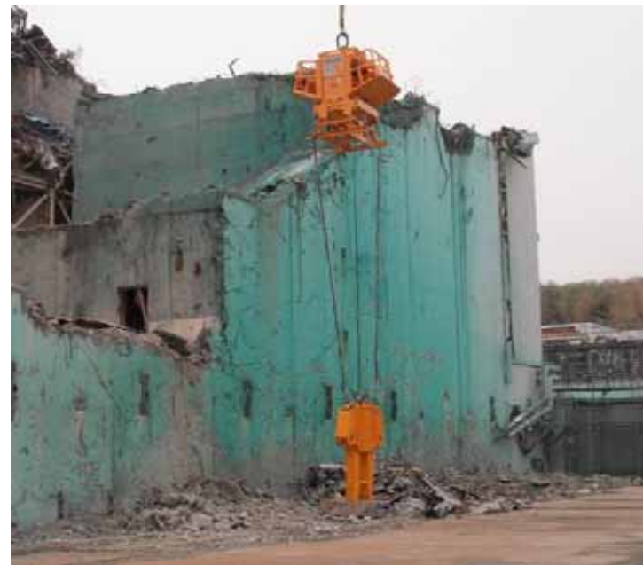
油圧ペンチ 散在瓦礫の撤去作業に使用