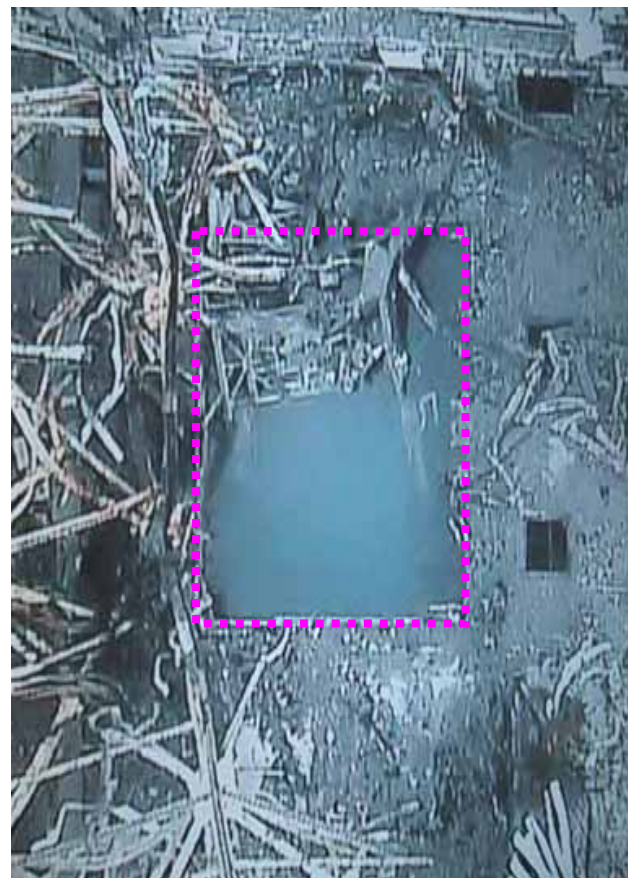
< 現在の状況 >