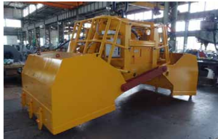
油圧Grabバケット スラブ上の瓦礫すくい上げ作業に使用