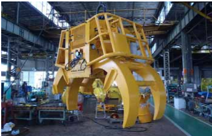
油圧フォーク 鋼材の把持、吊り降ろし作業に使用