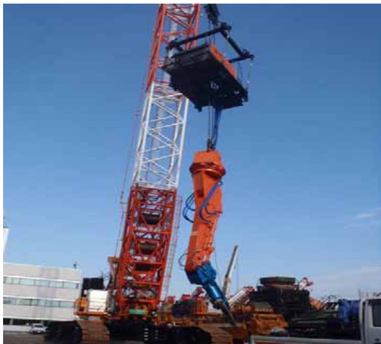
油圧カッター 屋根トラス、天井クレーンの切断に使用