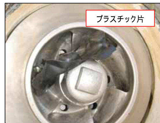
ポンプ本体側の状況 (吸込部取り外し後、ポンプ本体側を撮影)