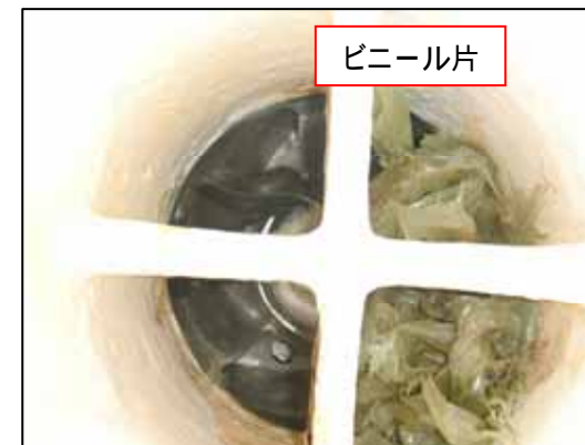
ポンプ吸込部拡大 (吸込部取り外し前に撮影)