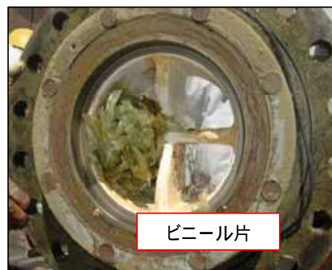
吸込部の裏側の状況 (吸込部取り外し後、裏側より撮影)