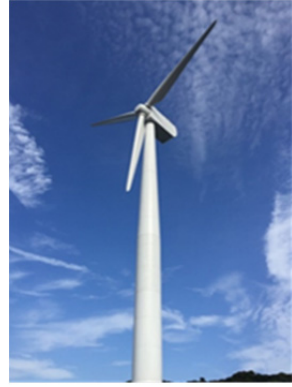
図1. 新島実証設備および配置図