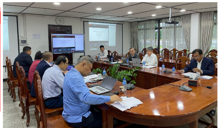
現地活動開始風景