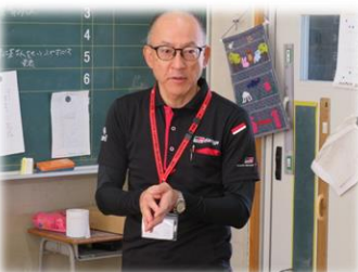
トヨタ ユナイテッド 様