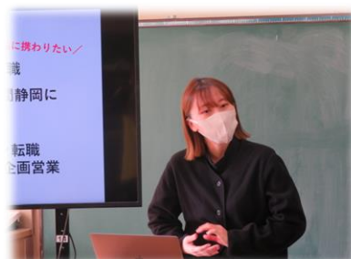
(有)サンディオス 様