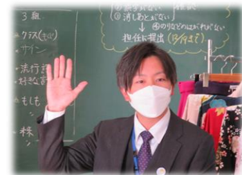
株式会社 平安 様