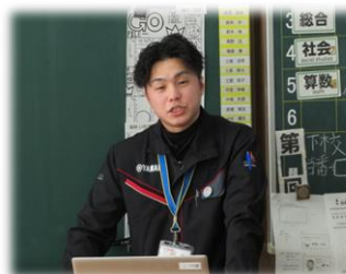
ヤマハモーターハイドロリックシステム 様