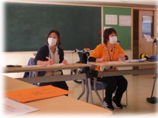
ヤザキ ケアセンター 紙風船 様