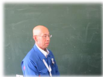
株式会社東配工 様