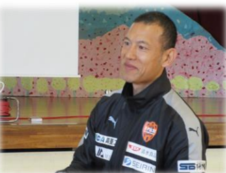
株式会社エスパルス 様