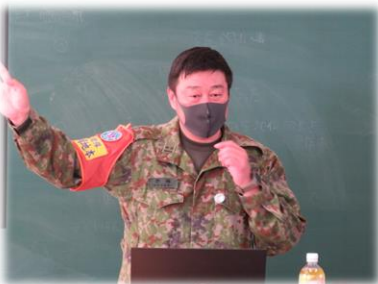
自衛隊静岡地方協力本部 沼津地域事務所 様