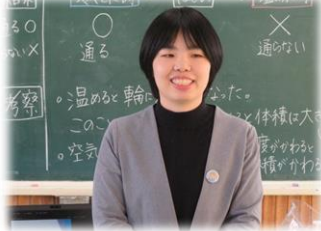
トライカンパニー 様