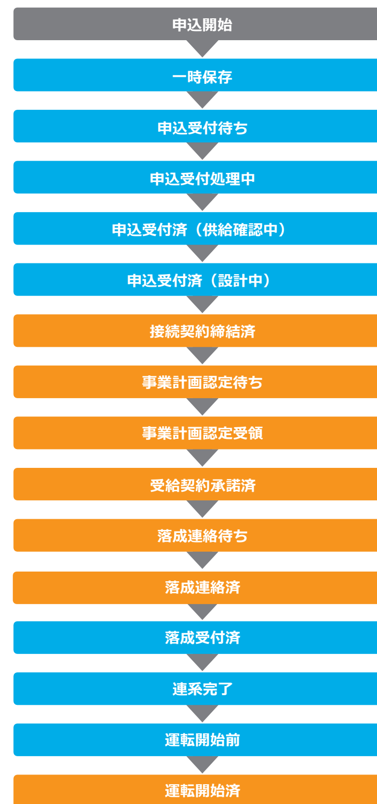
受給契約申込(新增設)ステータス遷移