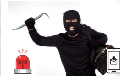
侵入センサーに反応したら