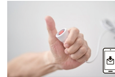
スイッチが押されたら