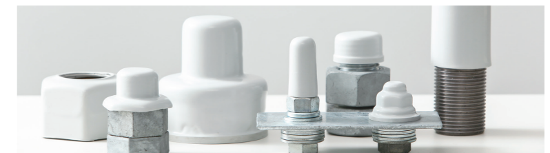
緩み止め&サビ止めキャップ「FITCAP」