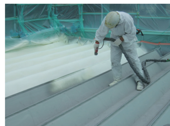
断熱材の吹付作業