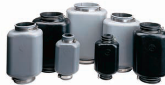
ゴム製エアカットバルブ