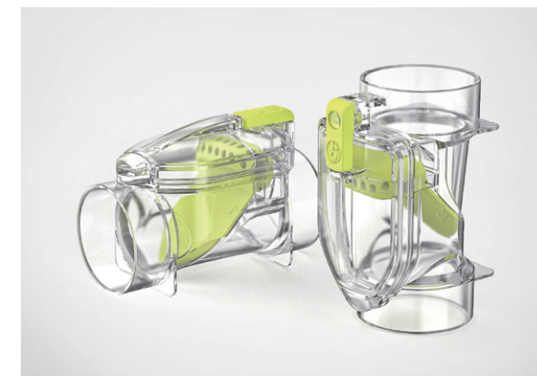
エアカットバルブオールクリア