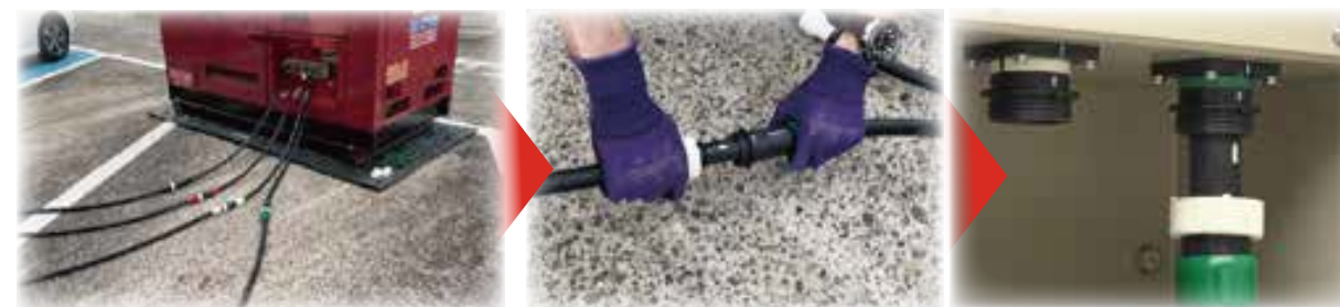
発電機・ケーブル 接続