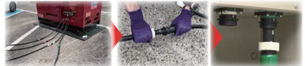
発電機・ケーブル 接続