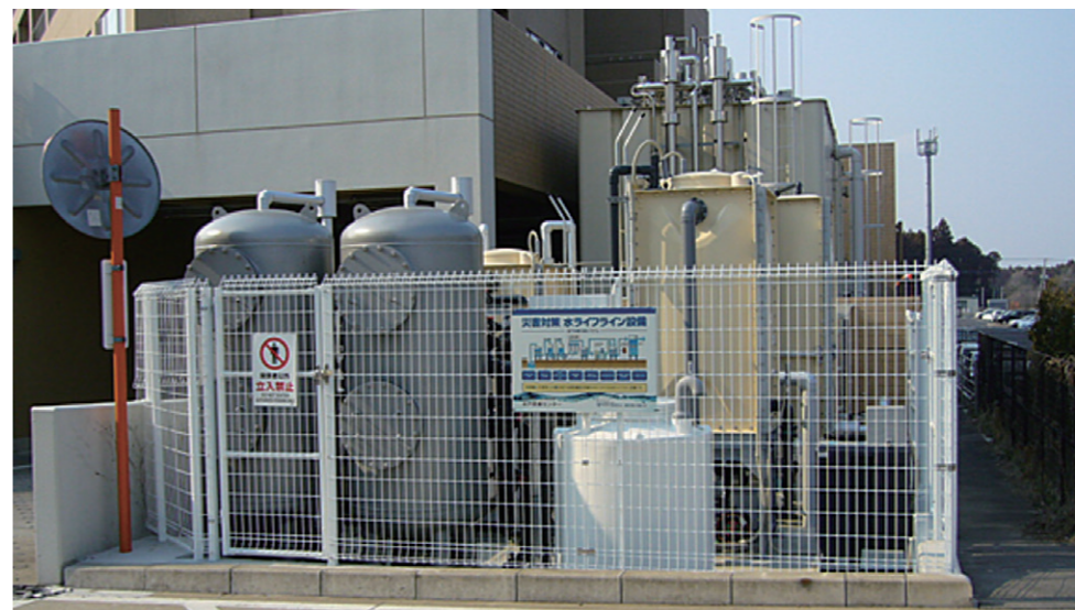
地下水飲料化システムの設置事例