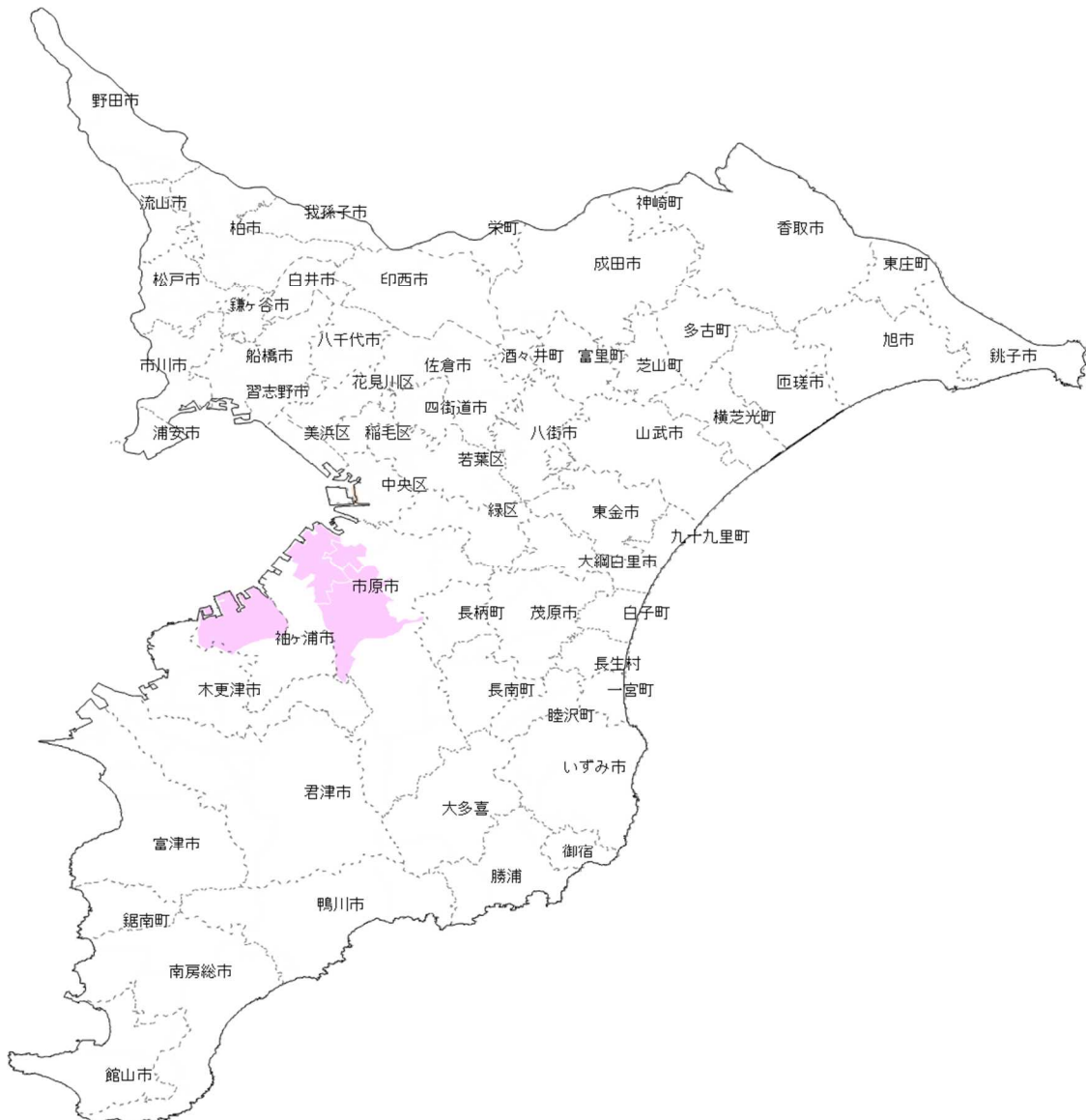
[募集対象エリア図]