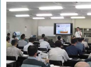
協力企業向けの新規制基準研修（柏崎刈羽）