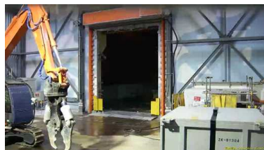
2号機 原子炉建屋西側開口部

2号機では、1、3号機と異なり、水素爆発による原子炉建屋の損傷を免れたことから、使用済燃料プールからの燃料の取り出しに向け、オペレーティングフロアへアクセスするための開口部を設置した（6月21日）。今後、開口部近傍のエリアを中心に、遠隔ロボットを使用した放射線量測定やカメラ撮影等の調査を開始する予定。