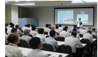
重要課題説明会（本社）

今年度の業務計画に対する職員の理解と関与を強化すべく、業務計画の中でも特に注力すべき重要課題の説明会を実施した（6月8日）。説明会は、TV会議を利用して本社、各発電所および新潟本部合同で開催し、本部長、発電所長をはじめとする各原子力リーダーが、原子力部門を取り巻く事業環境やマネジメントモデルを踏まえた重要課題と、その課題に対する自組織の取り組みを職員に対して直接説明、意見交換を行った。