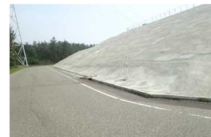
防火帯（整備完了後）

原子力規制委員会より2017年度の各発電所の訓練評価結果が公表された（7月2日）。設定された項目それぞれに対して三段階で評価されており、最良の「評価A」の取得率が、3発電所平均56%に低下（2016年度は76%）した。「評価A」が取れなかった項目については、原子力規制委員会との情報共有において、当社からの説明やプラント情報システムの伝送ができなくなった場合の対応が十分で無かったことなどが指摘されている。今年度は、緊急時における発電所～本社～原子力規制委員会間のタイムリーな状況共有が行えるよう、情報共有専任要員の配置等の運用の改善を図っていく。