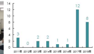
原子炉主任技術者試験筆記試験合格者数推移

新規制基準に関する研修として、柏崎刈羽と福島第二において「柏崎刈羽6/7号機設置変更許可研修」を実施している。今年度からは、安全対策工事等の法的根拠を理解して頂くために、当社社員だけでなく、40社以上の協力企業の所長や責任者に対象を広げている。