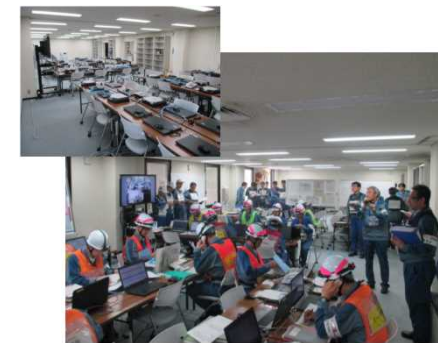
左上：模擬訓練室 右下：模擬訓練室での訓練（柏崎刈羽）

5号機サービス建屋の模擬訓練室を使用することで、緊急時対策所への参集を模擬することが可能となり、5号機緊急時対策所が設置されるまで、積極的に活用していく。