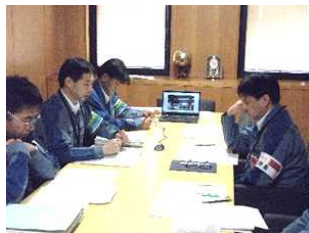
原子力安全監視室から所長への監視結果報告（柏崎刈羽）

各分野の重点課題を集中的に解決するために、セルフアセスメントを実施する仕組みを導入した。エクセレンスとのギャップを特定し、解決するための取り組みとして、社外のレビューからも良い評価を頂いている。柏崎刈羽では、メンテナンス分野における異物管理の重点セルフアセスメントを実施し（5月24、25日）、事例周知や異物管理の視点を取り入れた工事管理などの改善策を実行中。