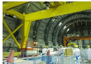
3号機 原子炉建屋オペレーティングフロアにおける試運転

5月11日にクレーン制御盤から異音が発生し、クレーンが停止し、制御盤内部にすずや損傷が確認された。調査の結果、制御盤内の保護装置の電圧設定が発電所の使用電圧と異なっていたため、回路に長時間電流が流れ、過熱し絶縁物の変形、短絡に至ったと判明した。電圧設定が誤っていたことや、これに先立ち2か月前から電圧設定の誤りを起因とする不具合が発生していたにもかかわらず原因究明が不十分だったことについては、メーカーや当社の品質管理上の問題があり、重要な教訓があると考えられるため、原因の深掘を進めていく。