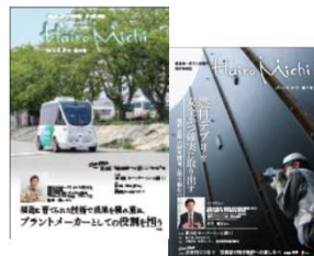
廃炉情報誌「はいろみち」（第7号、第8号）