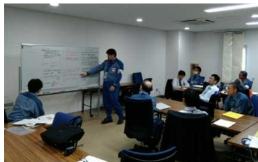
異物管理のセルフアセスメント（柏崎刈羽）