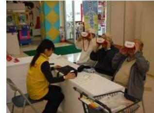
VRを活用したご説明

福島第一の廃炉情報誌「はいろみち」は当初は10,000部程度の配布だったが、ご了解を頂いた福島第一の周辺市町村に全戸配布させていただくなど配布先を順次拡大。4月10日に第7号（34,000部）、6月10日に第8号（40,000部）を配布し、「地元目線に立った資料だ」などの声をいただいている。