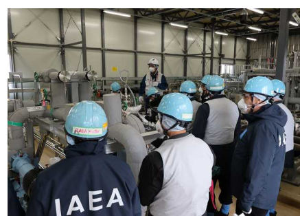
視察輸送設備的專案小組 (2024年 12月11日 福島第一核電廠)

※1 IAEA專案小組中，有6名IAEA職員和9名國際專家到訪日本 (國際專家：阿根廷、英國、加拿大、韓國、中國、法國、美國、越南、俄羅斯)