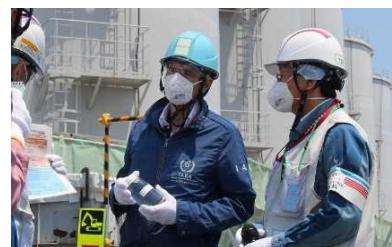
IAEA的格羅西事務局長（Rafael Mariano Grossi）視察ALPS處理水相關設備（2022年5月）