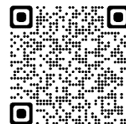
綜合報告書（左）與原文連結（右）