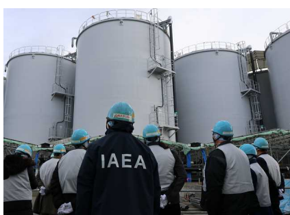
視察測量、確認用設備的專案小組 (2024年12月11日 福島第一核電廠)